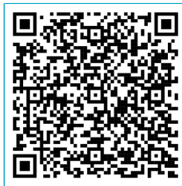
QR Code 報名